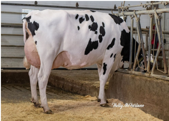
PROGENESIS JEDI MENACE GRANDDAM